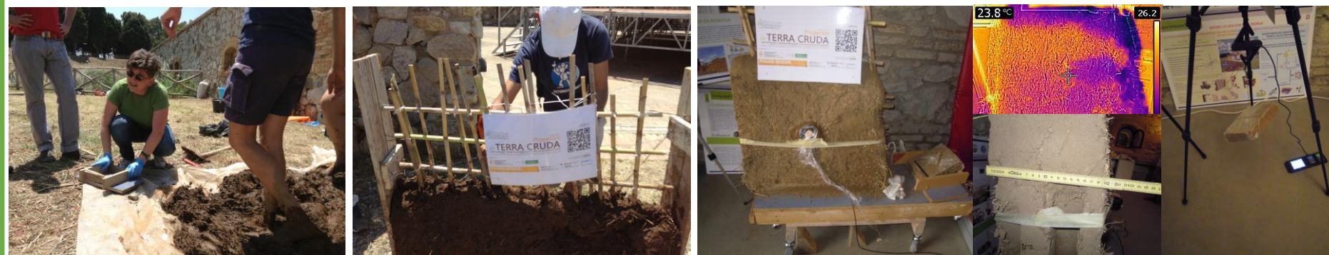
LivingLab School ABITAlab Cantiere di Autocostruzione e Monitoraggio Prestazioni Muro in Terra cruda _ tipo Torchis